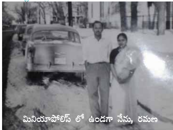
మినియాపోలిస్ లో ఉండగా నేను, రమణ