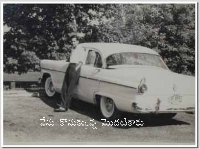
నేను కొనుక్కున్న మొదటికారు

ఐతే వీసా సమస్య వల్ల మధ్యలో ఇండియా వెళ్ళి పోయి మద్రాసు ఐ.ఐ.టి లో లెక్చరర్ గా పనిచేసి, మళ్ళీ విస్కాన్సిన్ యూనివర్సిటీ స్పాన్సర్ ద్వారా 1967లో తిరిగి అమెరికా వచ్చాను. మధ్యలో ఇంకొక సారి 1987 లో మలేషియాలో 2 సంవత్సరాలు మినహాయించి దాదాపు 34 సంవత్సరాల పాటు యూనివర్సిటీ ఆఫ్ విస్కాన్సిన్ లోనే పనిచేశాను. చివరిలో 7