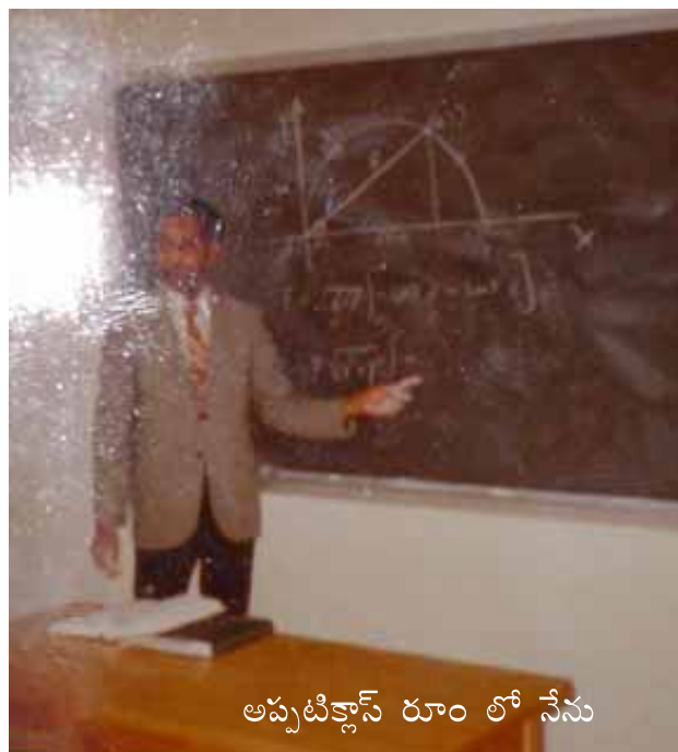
అప్పటిక్లాస్ రూం లో నేను

అప్పట్లో ఇండియన్ స్టూడెంట్స్ చాలా తక్కువమంది ఉండేవారు. తెలుగు వారి సంగతైతే చెప్పాల్సిన పనే లేదు. వేళ్ళ మీద లెక్కబెట్ట గలిగినంత మంది ఉండేవారంతే. నేను వచ్చింది పి -45 వీసా అవడం వల్ల బయట పని చేసుకునేందుకు వెసులుబాటు ఉండేది. రెండు మూడేండ్లు ఎలానో నెట్టేశాను గానీ 1958 లో వినోద కూడా అమెరికా వచ్చినప్పుడు నాకొచ్చే