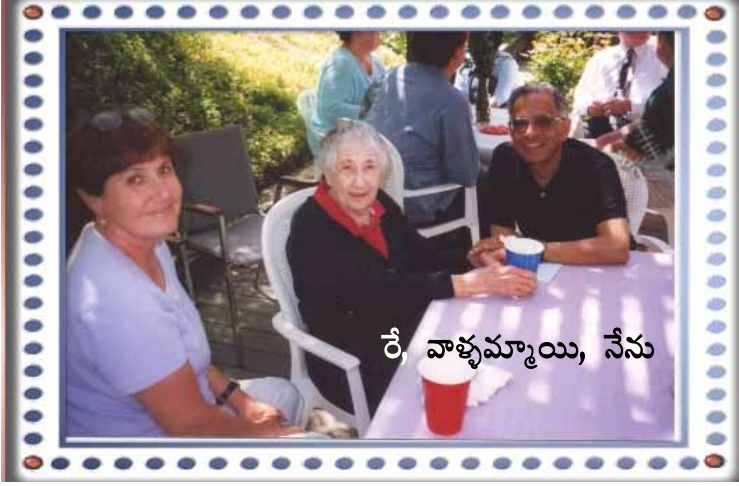
రే వాళ్ళమ్మాయి, నేను

మాట తీరు చూసి వెంటనే ఒక నెల అద్దె ఇచ్చేసి గదిలో ఉండటానికి నిశ్చయించుకున్నాను.