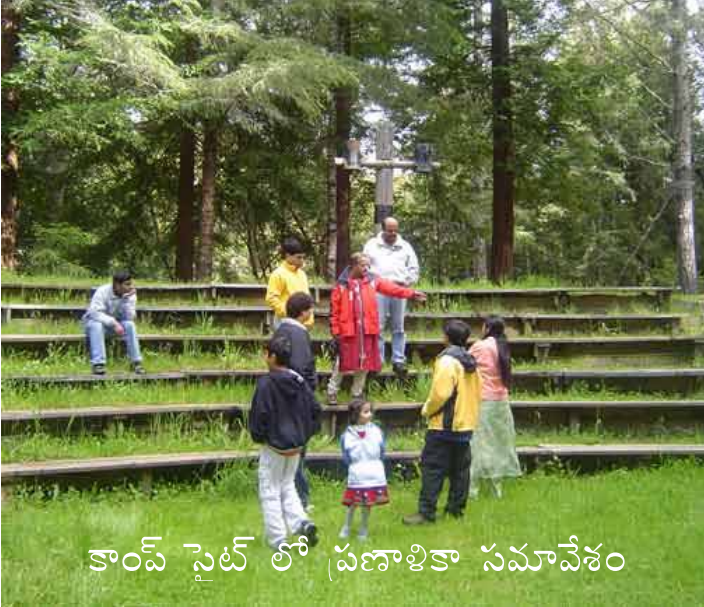
కాంప్ సైట్ లో ప్రణాళికా సమావేశం

క్రిందటి సంవత్సరం సరిగ్గా ఇలానే మే మొదటి వారంలో జరిగిన ఆంధ్ర కుటుంబశిబిరం తీపిజ్ఞాపకాలు ఇంకా శిబిరవాసుల మనసుల్లో తాజాగా మెదులుతుండగానే, మరోసారి అద్భుతమైన అనుభవాన్ని అందించేందుకు సిలికానాంధ్ర కార్యకర్తలు అహరహం శ్రమిస్తున్నారు. 400 మందికి (పిల్లలూ, పెద్ద వారూ..) రెండు రోజులపాటు కొండల మధ్యన, దట్టమైన అడవుల్లో పూర్తి గ్రామీణ వాతావరణాన్ని సృష్టించేందుకు ఏర్పాట్లు పూర్తయ్యాయి. కాంప్ కి సరిపడా సభ్యత్వాలు కూడా ఈ పాటికే వచ్చేశాయి. వారం రోజులు ముందుగానే రిజిస్ట్రేషన్స్ ముగియడం, తెలుగు వారికి సహజీవన సౌందర్యం పట్ల గల మక్కువని సూచిస్తోంది. అడవుల్లో పసందైన భోజనాలకూ, ఫలహారాలకూ కూడా ఎవ్వరికీ ఎలాంటి ఇబ్బందులూ లేకుండా ఉండేందుకు ఏర్పాట్లు చేస్తున్నారు. కాంప్ సైట్ లో ఏ సెల్ ఫోన్లూ పనిచేయవు ( ఎవ్వరూ మిమ్మల్ని విసిగించరన్నమాట..!)