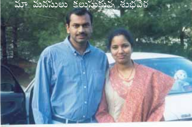
మా మనసులు కలుసుకున్న శుభవేళ

హైదరాబాద్ అవడంవల్ల, వాళ్ళూ వాళ్ళూ మాట్లాడుకోడానికి మంచి రోజులు నిర్ణయించుకోడానికి చాలా సులభమైంది. మా నిశ్చితార్థం ఫిబ్రవరి 17, 2000 న హైదరాబాదులో జరిగింది.., విశేష మేమిటంటే.. కార్యక్రమానికి మేమిద్దరమూ అక్కడ లేము..!!( విచిత్రంగా వుంది కదా..!)