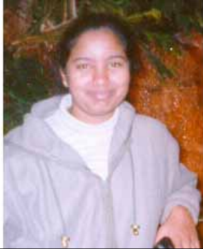
తను పంపిన మొదటి ఫోటో

ఆవిధంగా నంబరు చేతికి రాగానే..తమాషాగా.. 'మనీ' లోని పాట గుర్తొచ్చింది.. 'దెన్ స్టార్లెడ్ ట్రబుల్.. ' అని..! ఫోన్ చేసి మాట్లాడాలి.. ఏం మాట్లాడాలి..!? ఎప్పుడూ..ఎక్కువగా ఎవరూ అమ్మాయిలతో మాట్లాడలేదు.. సరే..అనుకుని పెద్ద ప్రపరేషన్నూ, స్క్రిప్టులూ ఏమీ లేకుండా.. ఫోన్ తీసుకుని డయల్ చేశాను.. 'ఎంతసేపు మాట్లాడుతాంలే.. మహా ఐదు నిమిషాలు..' అనుకున్నది 'హలో..' నుంచీ మొదలు పెట్టి మళ్ళీ ఈ లోకంలోకి వచ్చేసరికి సరిగ్గా గంట దాటింది. ఇంతసేపు ఓ కొత్త అమ్మాయితో మాట్లాడింది నేనేనా..అని ఆశ్చర్యం వేసింది..