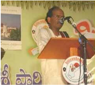
Click here to watch Video

కోయిల గానం కోసం ఎదురు చూస్తుంటే ఓ మూలగా పడివున్న కోయిలలు కనిపించాయి, ధవళకాంతులు చిందే వేపచెట్ల కోసం వెదుకుతుంటే పూతలేక, ఆకురాలు కాలంనుంచీ తేరుకోని చెట్లు నగ్నంగా దర్శనమిచ్చాయి, విరగ్గాసి, పచ్చటి పిందెలతో నిండుగా ఉండొచ్చిన మామిడి చెట్లు, విషాదభరిత యోగినుల్లా కనిపించాయి, వసంత కాంతులతో కేరింతలు కొట్టొచ్చిన పూలతోట